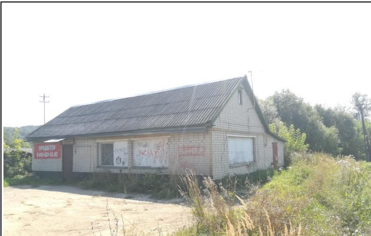
Вход в магазин